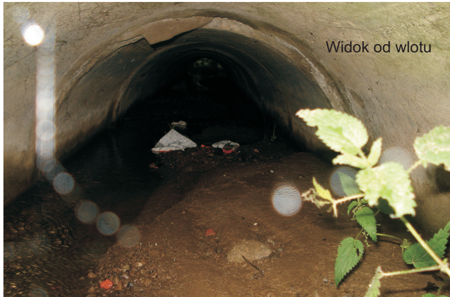
Widok od wlotu