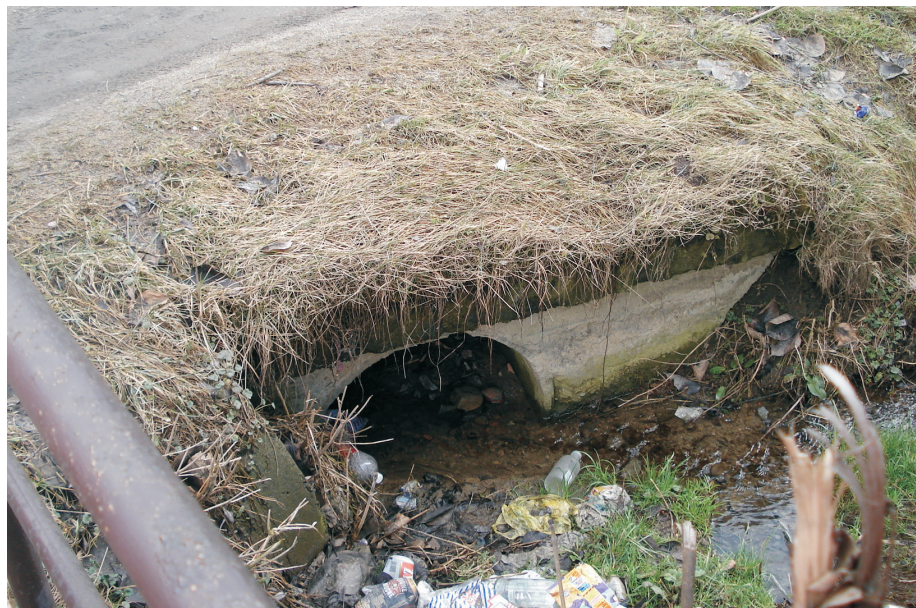
Widok od wlotu