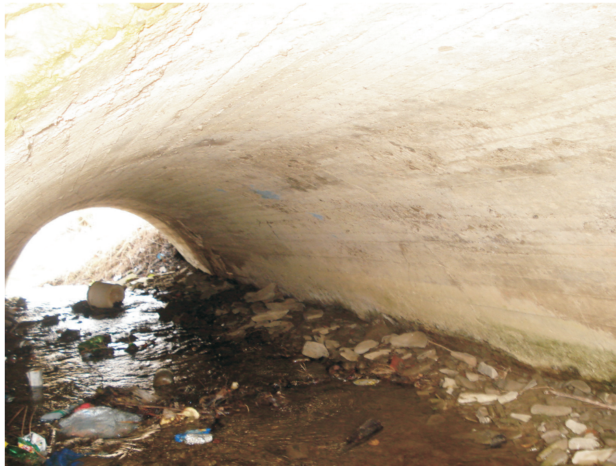
Prześwit od strony wlotu